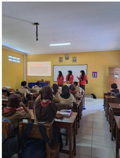
Gambar 1. Penyampaian materi penyuluhan bahaya penggunaan boraks pada makanan.