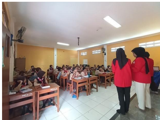
Gambar 2. Interaksi antara pemateri dan siswa selama kegiatan.