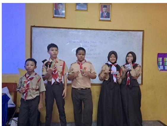
Gambar 3. Pemberian hadiah siswa/i yang berhasil menjawab pertanyaan dengan benar.

Untuk mengetahui sejauh mana materi penyuluhan mengenai bahaya boraks dapat dipahami oleh peserta serta untuk menilai efektivitas metode penyampaian yang digunakan, dilakukan proses evaluasi menggunakan kuesioner yang dibagikan setelah seluruh rangkaian kegiatan edukasi diselesaikan. Evaluasi ini bertujuan untuk mengukur