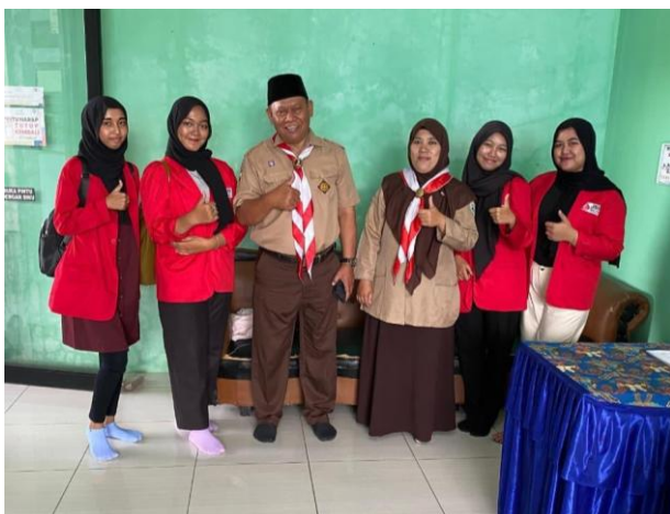
Gambar 5. Tim Penyuluhan dari JGU bersama guru SMP Gelora Depok.

Secara keseluruhan, hasil ini menegaskan bahwa penyuluhan sudah cukup efektif, namun beberapa bagian materi perlu diperkuat agar siswa dapat memahami risiko boraks secara lebih menyeluruh.