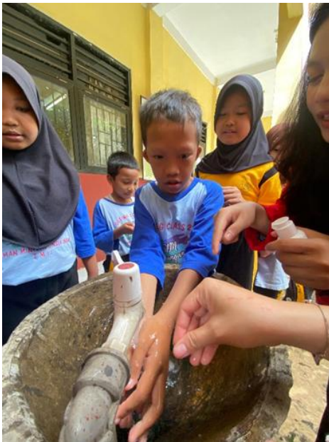
Gambar 2. Kegiatan praktik cuci tangan.

Setelah sesi penyampaian materi, kami langsung mempraktikkannya menggunakan air mengalir yang tersedia di sekolah tersebut. Praktik ini bertujuan untuk mengukur sejauh mana pemahaman siswa terhadap materi yang telah disampaikan. Setelah materi dan praktik selesai, kami memberikan post-test kepada lima siswa dan lima siswi, sama seperti saat kami memberikan pre-test sebelumnya.