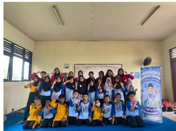
Gambar 4. Dokumentasi bersama siswa dan siswi.

Setelah dilakukan post-test , hasil menunjukkan bahwa 100% siswa dan siswi telah memahami pentingnya mencuci tangan sebelum makan dan setelah bermain. Hal ini membuktikan bahwa upaya kami dalam menyampaikan materi berhasil meningkatkan pemahaman siswa dan siswi mengenai pentingnya kebiasaan mencuci tangan.