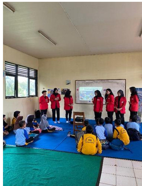
Gambar 1. Kegiatan pemaparan materi.

Disini kami memakai metode penyampaian materi dengan media power point yang kami buat dengan elemen semenarik mungkin agar mereka paham dengan apa yang kami sampaikan. Dan kami memberikan pertanyaan seputar materi, mereka sangat antusias dalam menjawab, karena kami juga menyediakan hadiah sebagai apresiasi mereka karna keberanian dan pengetahuan mereka tentang materi yang kami sampaikan.